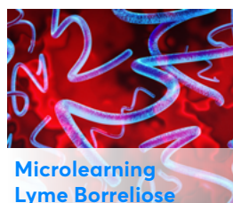
Microlearning Lyme Borreliose